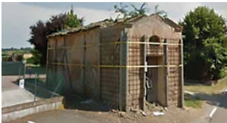
Immagine della chiesina abbattuta